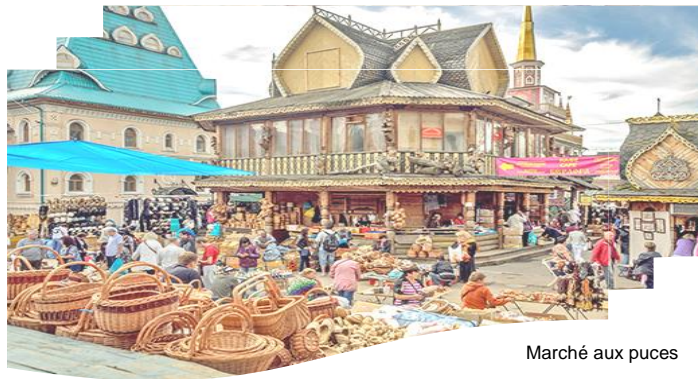
Marché aux puces