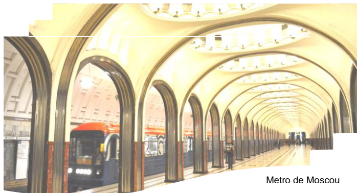
Metro de Moscou

> Petit déjeuner > Temps à disposition suivant l'horaire du vol retour > Transfert ( sans assistance ) à l'aéroport de Moscou > Formalités d'embarquement > Envol pour Bruxelles