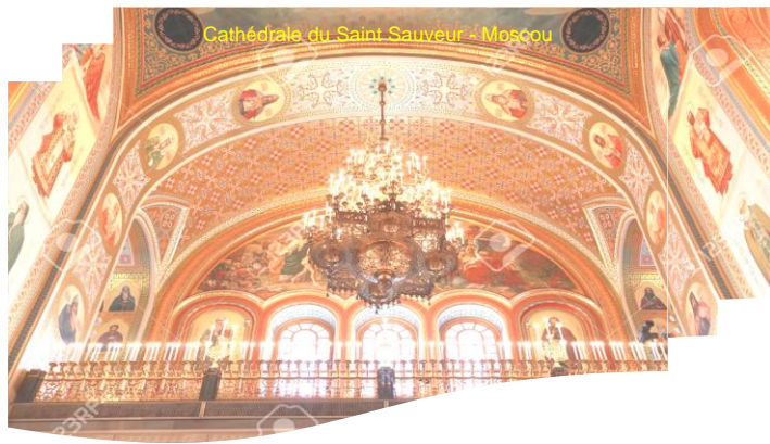
Cathédrale du Saint-Sauveur - Moscou