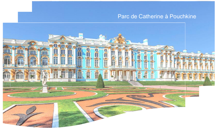
Parc de Catherine à Pouchkine

> Petit déjeuner > Départ pour la visite de la cathédrale de la Trinité un des plus grands bâtiments religieux à St. Pétersbourg et assistance partielle à la messe orthodoxe chantée > Visite du Parc de Catherine à Pouchkine qui abrite le Palais de Catherine avec une architecture allant du Rococo au Néoclassique > Déjeuner au restaurant > Dans l'après-midi, excursion à Pavlovsk et visite du palais de Paul I et du parc pour y apprécier le raffinement des salons, l'harmonie des couleurs, l'élégance des cheminées en marbre de Carrare, la grande collection de porcelaines, les peintures et les objets en ivoire > Retour à l'hôtel > Dîner à l'hôtel (OU avec supplément : Diner d'adieu au restaurant « Izba Podvoré » avec animation folklorique, vin et vodka à volonté) > Nuitée